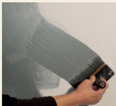
WOOL - Distribuire il prodotto casualmente Apply the product in a random way