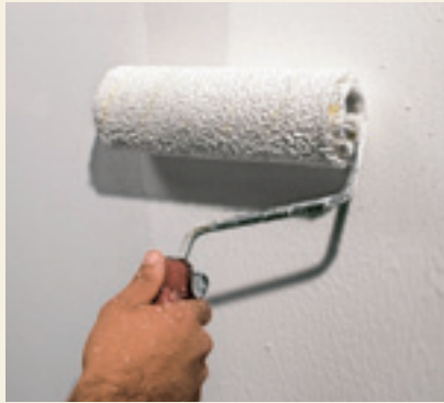
Preparazione: Primus Sabbia Undercoat: Primus Sabbia