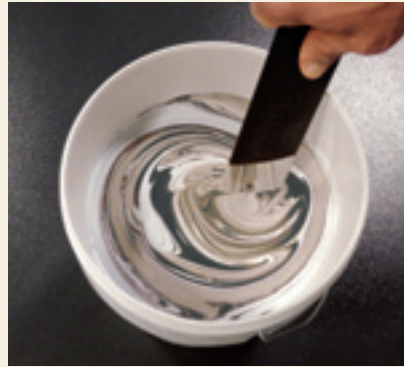
Miscelare bene il prodotto con la nostra spada in plastica Stir well the product using our plastic mixing sword