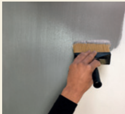
COTTON - Distribuire il prodotto verticalmente Apply the material vertically