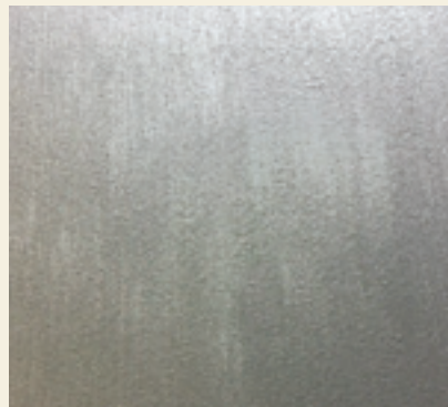
COTTON - Lasciare asciugare. Una eventuale seconda mano rende l'effetto più opaco e omogeneo Let dry. A second layer is possible and it gives a more matt and homogenous effect